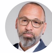
Frank Preuss Network